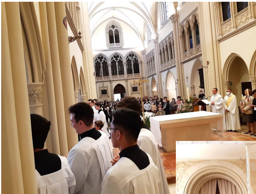
Après avoir accueilli la vénérable statue de Notre-Dame du château, la Mère

supérieure du monastère de la Visitation et les sœurs, offrent avec une grande gentillesse, un petit cadeau à chacun des nouveaux communiants.