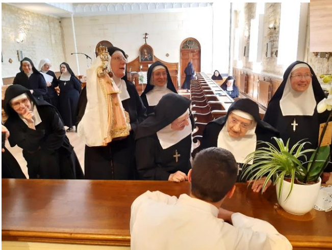
Prières, chants et louanges à notre Sainte Vierge Marie, notre Maman céleste.

† Prions, louons et glorifions le Seigneur pour tant de grâces et de joies reçues et vécues en ce saint et beau Jour de fête.