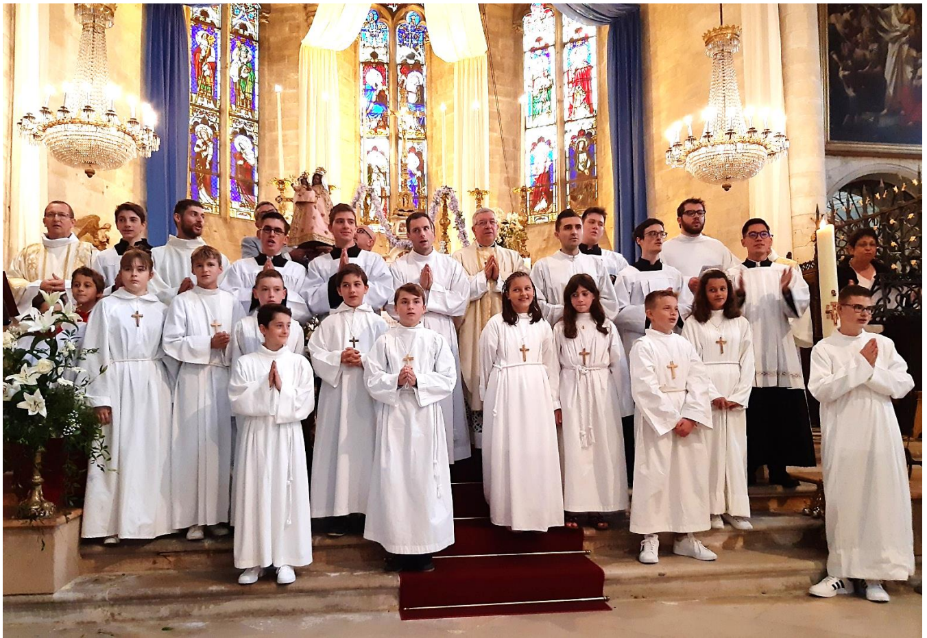
Petite photo de « famille » prise en fin de messe.

« A travers ces sourires, cette Joie profonde que chacun a pu exprimer, ils nous montrent que l'Amour de Dieu, est plus fort que tout. Comment ne pas être touché, par cet état de Grâce que nous avons vécu ce 13 mai 2021, chacun d'entre nous si différents et pourtant unis par le même désir, la même soif de connaître Dieu, d'être rempli de son Amour.