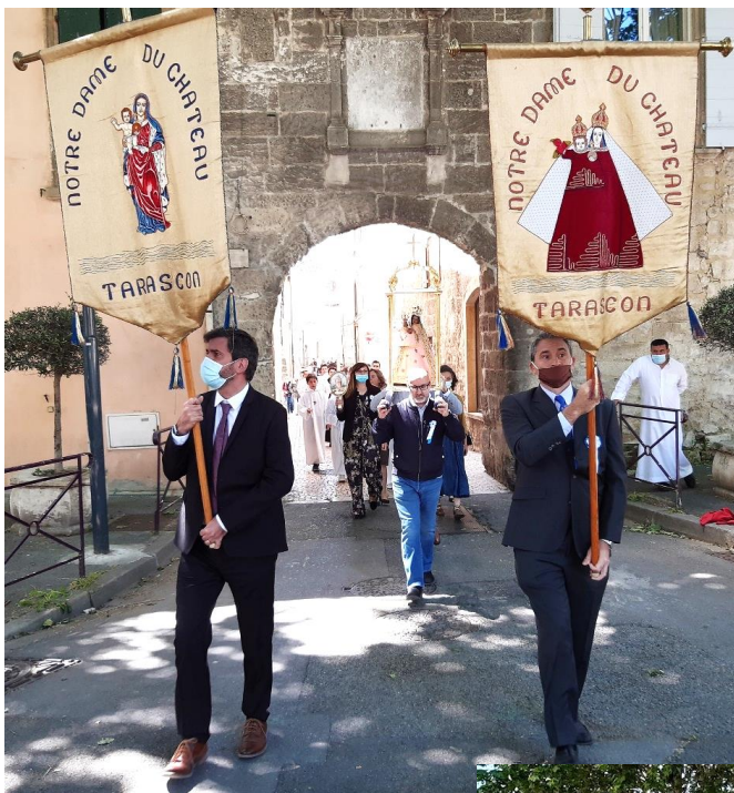
Arrivée de la procession à la porte Jarnègue

Nous approchons maintenant du Monastère de la Visitation