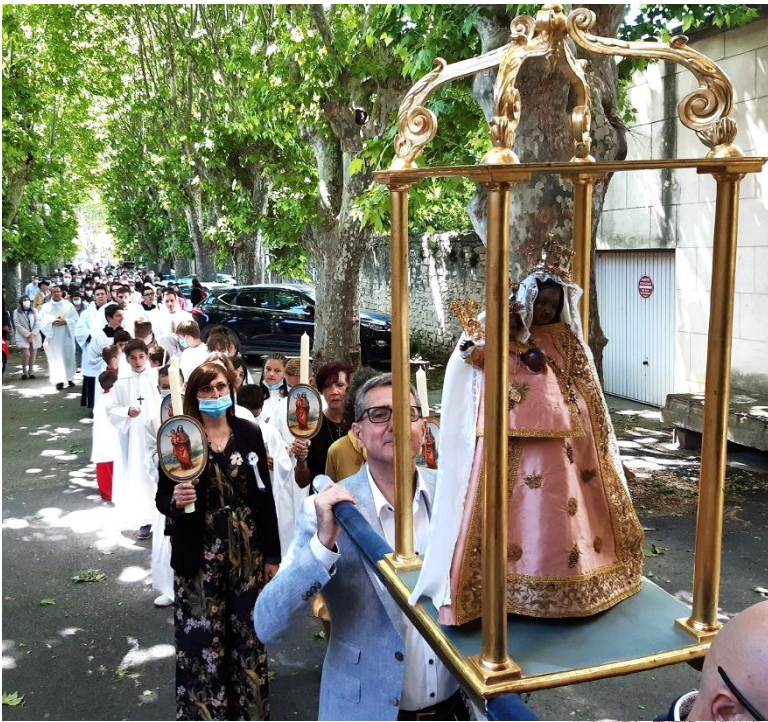
Entrée de Notre-Dame du Château et de la procession dans la très belle chapelle du Monastère.